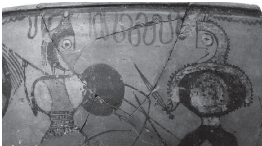
Vaso de los Guerreros, Museo Numantino (Soria). Siglo I. a.C. Es la pieza cerámica celtíbera más conocida que representa a dos guerreros con equipo militar y vestimenta de tradición indígena

produjo hasta el año 154 a.C., cuando grupos de lusitanos liderados por un tal Púnico, asaltaron el territorio de la Hispania Ulterior y vencieron al pretor de la provincia, provocando, según Apiano, 6.000 bajas en el bando romano y consiguiendo el apoyo de los pueblos vecinos. A Púnico le sucedieron como líderes de las bandas lusitanas Caisaros y posteriormente Caucainos, que continuaron los ataques y depredaciones.