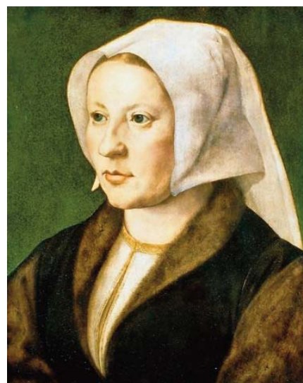
Isabel de Habsburgo

Su muerte fue lamentada por toda Europa. Se celebraron misas en su honor en Dinamarca, los Países Bajos, Hungría y España. Dicho honor no fue concedido a ninguna otra reina danesa, ni antes ni después de ella.