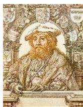
Christian II, en un grabado de 1523, por Jan Gossaert

Además, las relaciones del rey con la bellísima Dyveke Willums significaban un verdadero obstáculo para el entendimiento de la pareja. La madre de Dyveke, Sigbrit Willums, era la consejera del rey de Dinamarca.