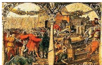
El Baño de sangre de Estocolmo.

El día 13 de abril, a bordo del navío El León , el rey y su familia abandonan Dinamarca rumbo a los Países Bajos, donde fueron recibidos por Margarita de Austria. Isabel no volvió nunca más a Dinamarca.