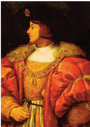
Luis II de Hungría

Fernando, encargado de administrar las posesiones de la familia en Alemania, era su hermano favorito, en parte por ser el segundón, pero María siempre antepuso su lealtad a Carlos, como la cabeza de la familia que era.