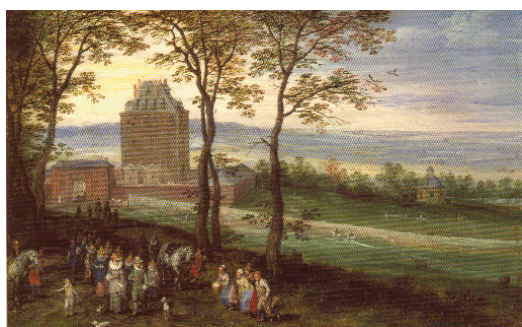
Mariemont, óleo de Bruegel

Durante los 24 años que duró su gobierno en los Países Bajos (1531-1555), dichos estados conocieron una prosperidad y tranquilidad que no habían tenido en siglos.