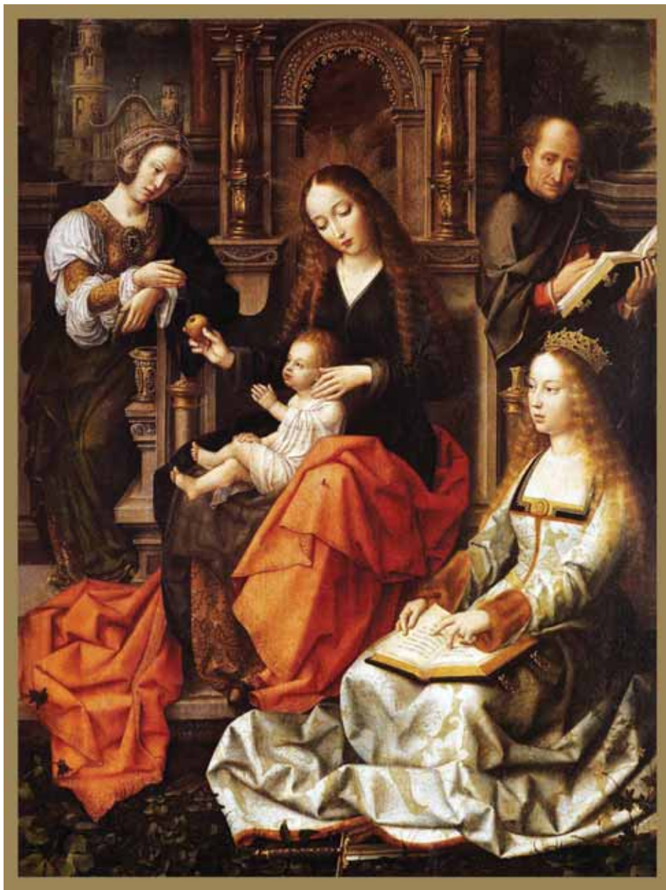
ANÓNIMO. La Virgen de la mosca (h. 1518). Sacristía de la Colegiata de Toro. Tabla al óleo cuyo nombre procede de una pequeña mosca inmortalizada en el centro mismo de la escena. Existen distintas versiones sobre la identidad de la mujer de la derecha. A pesar de que el cuadro llegó a ser atribuido a pintores como Michel Sittow o Fernando Gallego, aún no se ha identificado al verdadero autor.