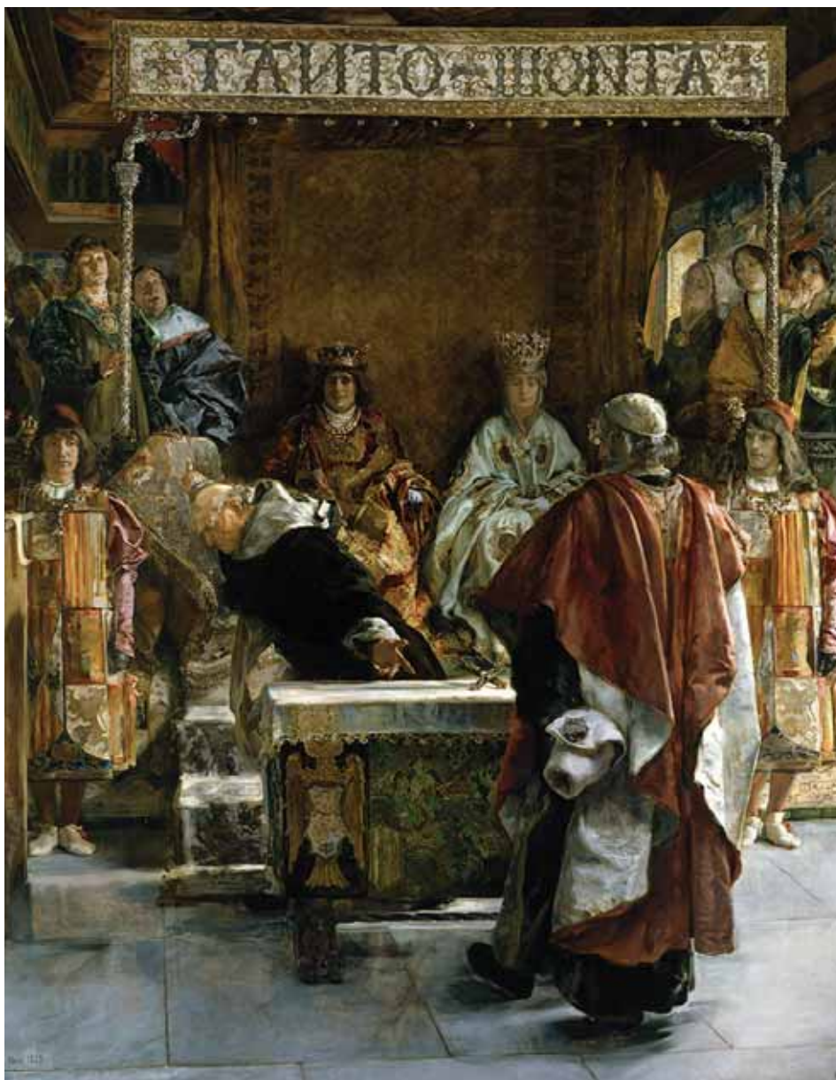
SALA, Emilio. Expulsión de los judíos (1889). Museo Nacional del Prado, Madrid. Una de las decisiones más controvertidas que tomó la reina Isabel fue la expulsión de los judíos de sus reinos. Tras años de conflictos y continuas dudas sobre su convivencia con la población cristiana, el decreto de expulsión de los judíos fue una realidad en 1492.