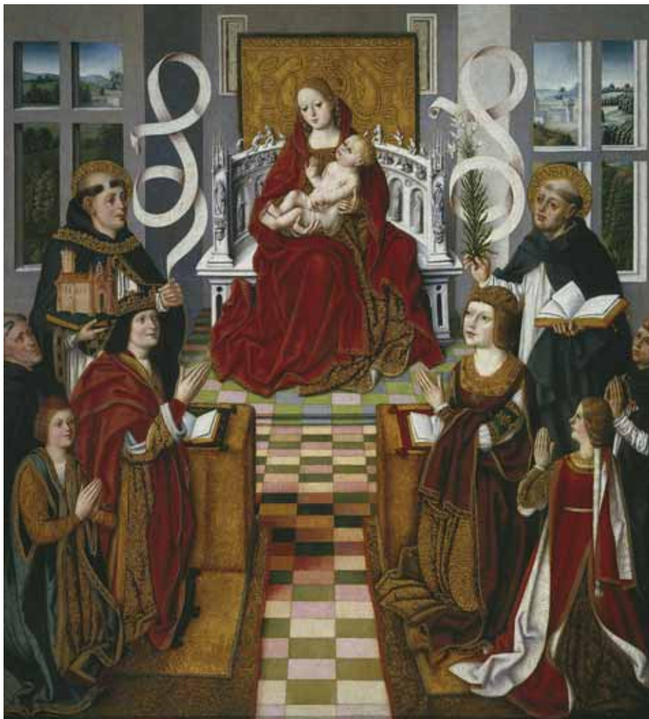
ANÓNIMO. La Virgen de los Reyes Católicos (1491-1493). Museo Nacional del Prado, Madrid. La Virgen es en este cuadro la protagonista principal. A ella adoran varios personajes, entre ellos una reina Isabel de rostro idealizado si lo comparamos con los dos retratos anónimos del Castillo de Windsor y del Museo del Prado.

una mujer piadosa, de rostro serio. La mirada de los dos cuadros es muy similar al retrato de Juan de Flandes que se conserva en el Palacio Real. Pintado solamente unos años después que los dos anteriores, entre 1500 y 1504, aquí vemos a una reina un poco mayor cuyos rasgos se