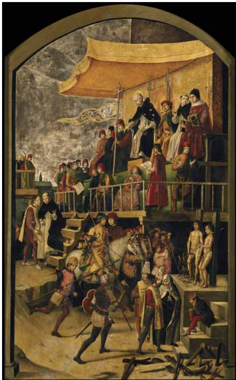
BERRUGUETE, Pedro. Auto de fe presidido por Santo Domingo de Guzmán (h. 1500). Museo Nacional del Prado, Madrid. Los autos de fe se convirtieron durante siglos en espectáculos de muerte a los que acudían centenares de personas. En un entarimado se juzgaba públicamente a los detenidos acusados de herejía. Pocas veces lograban salvar sus vidas.