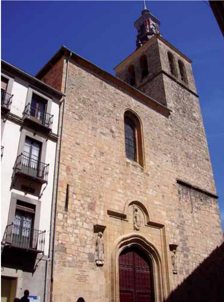
Iglesia de San Miguel de Segovia. La iglesia actual de San Miguel se construyó sobre la original de estilo románico en la que Isabel se proclamó reina en el invierno de 1474.

iba a ser el del orden y la ley, en el que iba a gobernar por el bien de todos sus súbditos. Con ella llegaría un tiempo de paz y armonía, prosperidad y crecimiento. Legitimidad y estabilidad eran, en fin, los dos ejes centrales de la propaganda regia de la nueva reina, que adoptaría también su esposo, cuando gobernarán ya como los Reyes Católicos. Sin olvidarnos, aspecto muy importante, de la misión divina de la que Isabel creía ser intermediaria.