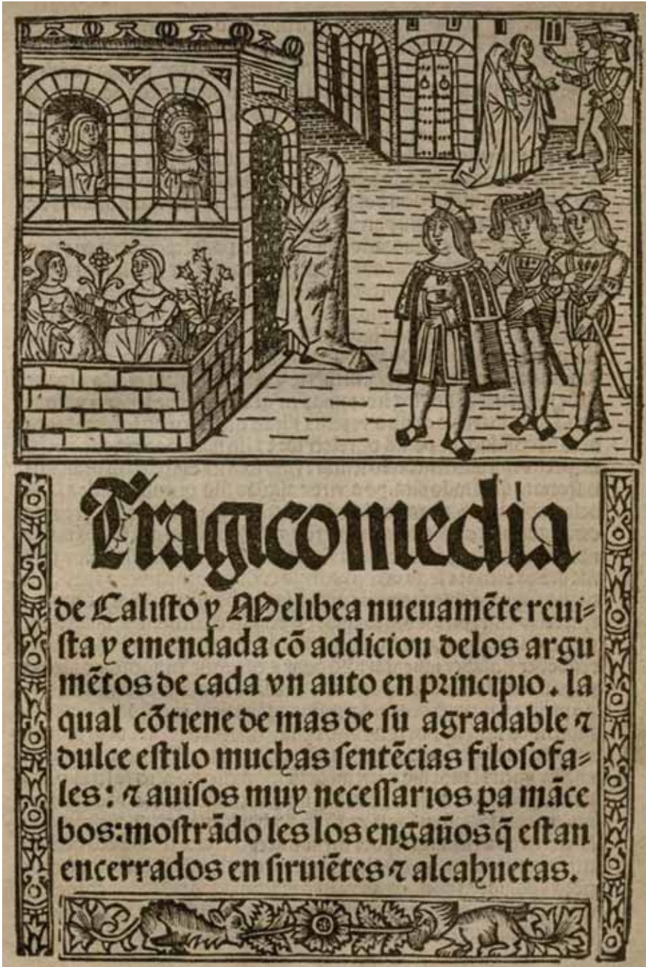
Portada de La Celestina . La Tragicomedia de Calisto y Melibea , atribuida a Fernando de Rojas, fue escrita a finales del siglo xv y tuvo una gran repercusión en los años posteriores.