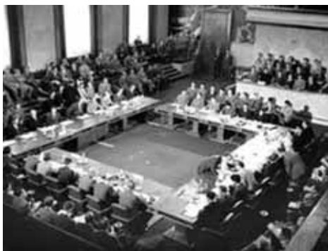
La Conferencia de Ginebra, 1954.