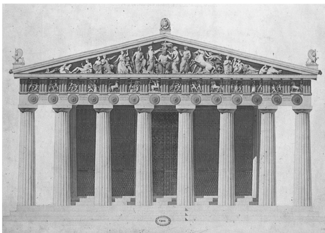
Dibujo que muestra una reconstrucción del Partenón en su momento de máximo esplendor en el siglo V a. C.

gos para construir una capital digna de su nación? Fue una decisión arbitraria y sin duda injusta, pero permitió que a las generaciones posteriores les fueran legadas unas obras de arte de una categoría como muy pocas veces se han elaborado a lo largo de toda la historia.