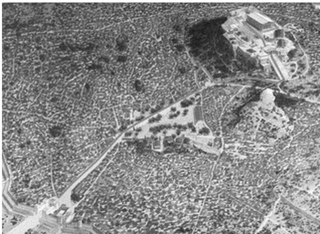
Vía de las Panateneas en el Ágora. El dibujo presenta una reconstrucción del espacio principal de Atenas.

islas cercanas, donde estaría protegida por la flota recién construida. Pero para ello, había que detener el avance persa hasta que diera tiempo a sacarlos de la ciudad. Para conseguir esto, trescientos espartanos a las órdenes de Leónidas, rey de Esparta, y varios miles de griegos más (beocios, tebanos...) se sacrificaron en el paso de las Termópilas, mientras le daba tiempo a la población del Ática a ponerse a resguardo. Su sacrificio no fue en vano. Cuando los persas acabaron con ellos y llegaron a Atenas, la ciudad había sido ya prácticamente abandonada.