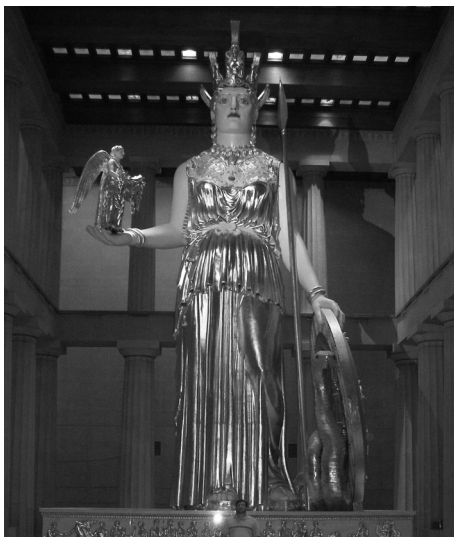
Reconstrucción actual de la estatua crisoelefantina de Palas Atenea del Partenón. Se encuentra en la ciudad estadounidense de Nashville.

Pericles encargó al arquitecto Ictinio la construcción de un nuevo templo dedicado a Palas Atenea que sustituyera al que existía hasta entonces. Es el Partenón que hoy día conocemos, aunque actualmente y desde hace siglos se halle en ruinas. Ictinio, junto con Calícrates, ambos arquitectos, levantaron en quince años un enorme templo de mármol de unos setenta metros de largo por treinta de ancho. El encargado de esculpir las estatuas fue el escultor griego más grande de toda la historia, y uno de los más grandes de todos los tiempos: Fidias.