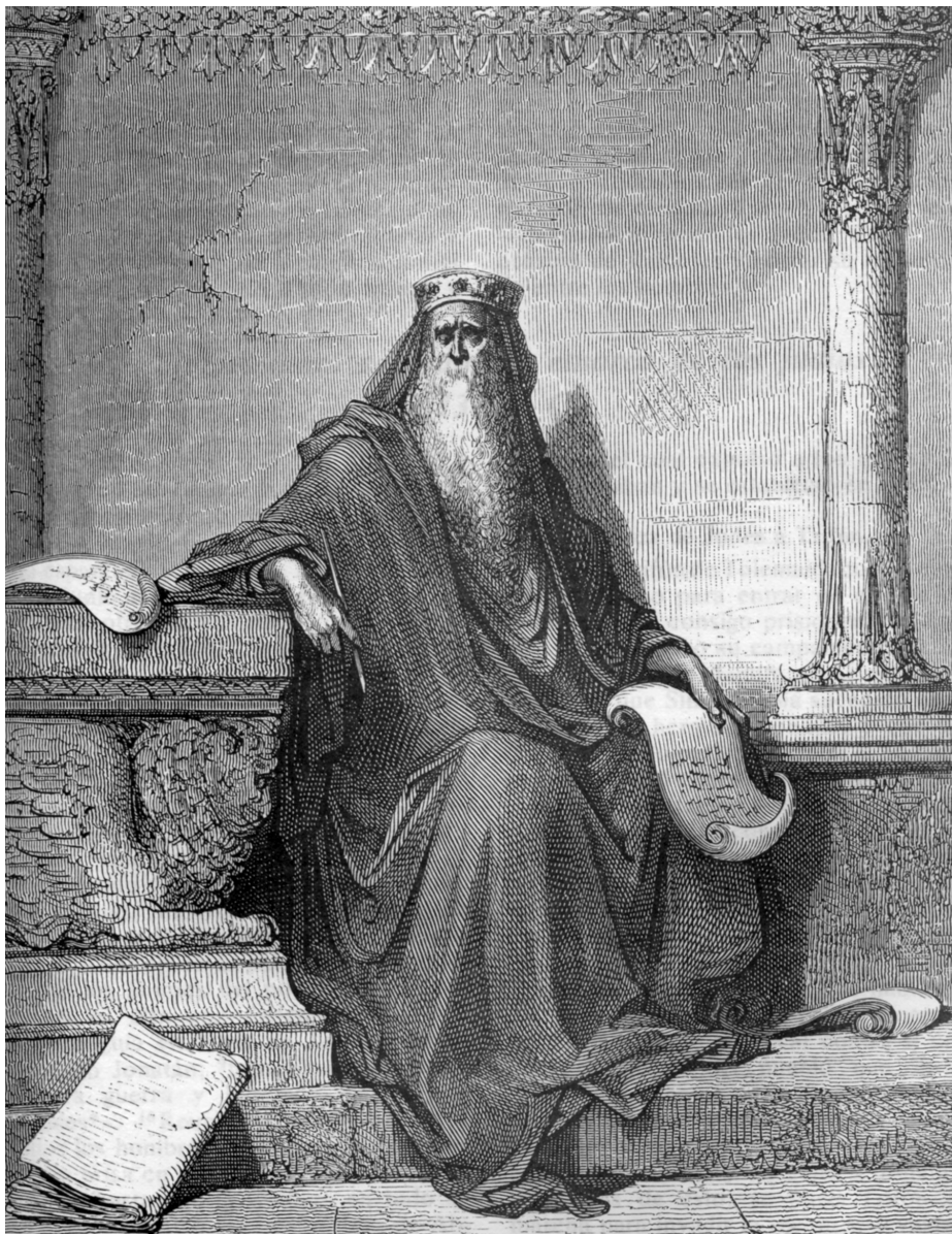
Salomón, el más sabio y rico rey de Israel.