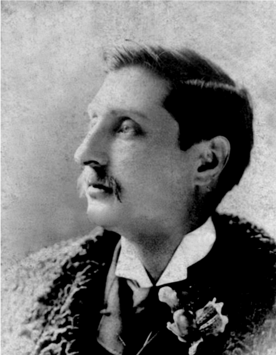
El escritor Rider Haggard. Se inspiró en la vida del cazador y aventurero Selous para escribir Las minas del rey Salomón y alcanzar con ello fama mundial.