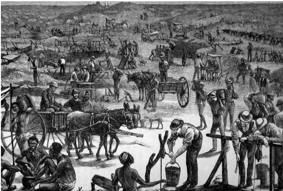
Una mina sudafricana de diamantes a finales del siglo XIX.

Les invito a dar un paseo por la parte más oscura y probablemente más desconocida del Imperio británico en África y que, por razones obvias, Haggard omitió en su novela, donde el hombre blanco y el negro sacaron sus más bajos y salvajes instintos. Pero este libro también es para aquellos que, independientemente de la generación que sean, les ha tocado vivir en la moderna, tecnológica y relativista sociedad occidental, ello no nos impide mirar al pasado y buscar, en medio de la historia, un tiempo en el que la exploración, la aventura, los ideales y, por qué ocultarlo, las grandes batallas, en este caso de la época colonial británica, son, y seguirán siendo, un espejo de vivencias humanas que nos tienen atrapados en un tiempo en el que, como es mi caso y por innumerables motivos, nos hubiera encantado estar presentes.