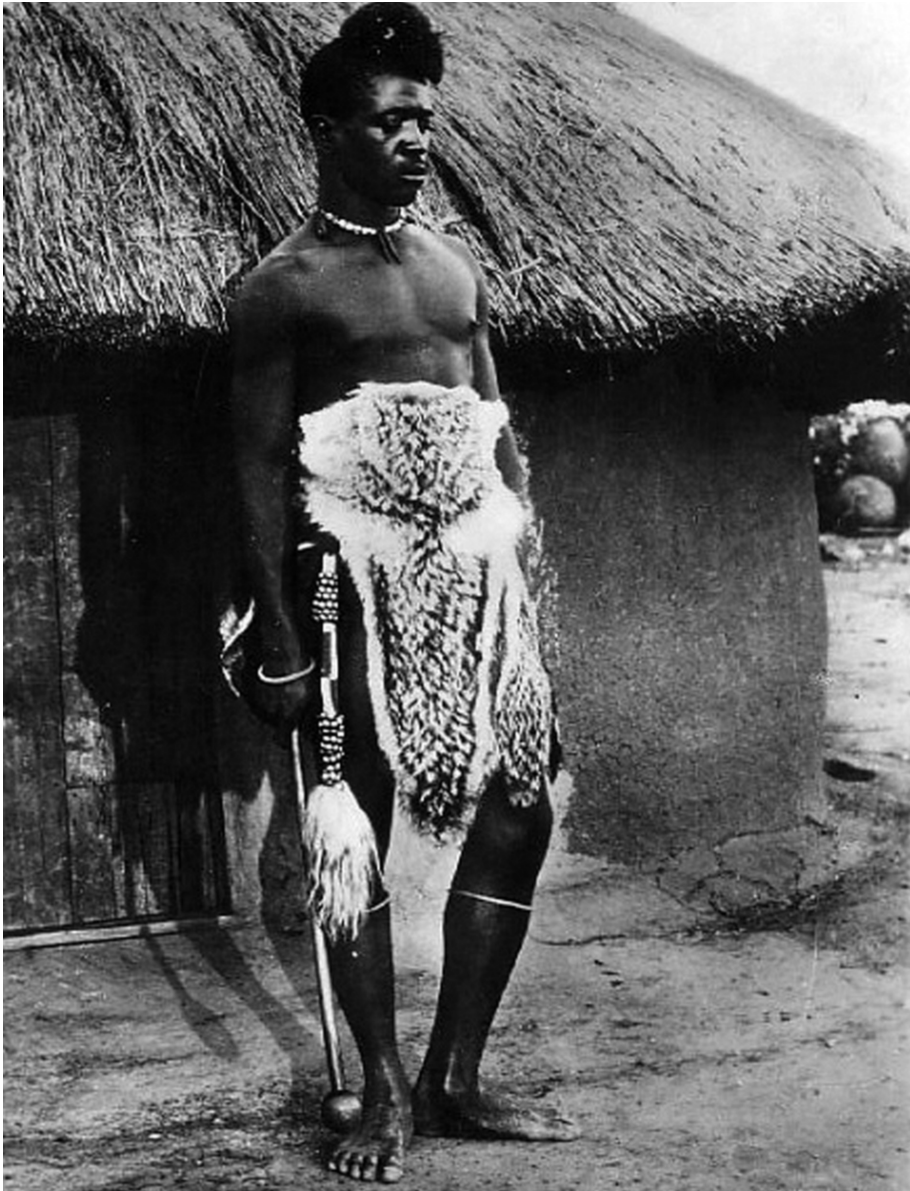
Guerrero matabele del regimiento mNbezu .