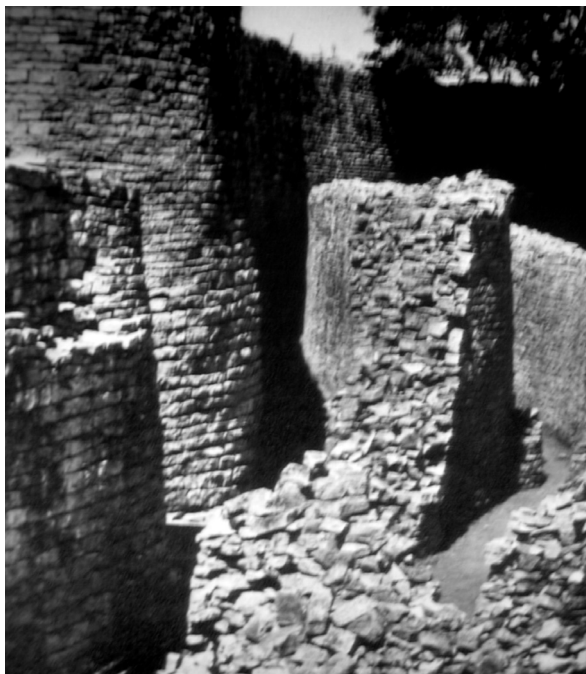
Las ruinas de la ciudad de piedra en Zimbabwe, origen de la leyenda de las minas del rey Salomón en África.

tencia de un misterioso lugar en el interior del África Austral, con grandes murallas de piedras que escondía un fabuloso tesoro. Tendrían que pasar dos siglos más para que la leyenda volviera a recuperarse gracias a la actividad de árabes y portugueses con las minas de oro, marfil y el tráfico de esclavos, quienes afirmaban que una civilización perdida, asentada a muy pocos kilómetros de la actual ciudad de Masvingo, escondía una gran riqueza.